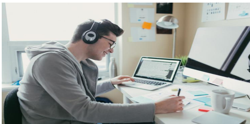
Figura 1. Representación gráfica del teletrabajo

Así mismo, los líderes de talento humano visualizaban en las empresas modernas, nuevas "prácticas laborales" como: el salario emocional, responsabilidad social corporativa orientado a la gente, cómo conciliar el trabajo y la vida familiar, etc. estos procesos de talento humano nos llevarían a buscar un equilibrio y funcionalidad entre el trabajo y las expectativas de los nuevos trabajadores del siglo XXI combinando sus espacios de vida, deporte, desarrollo académico y tiempo de calidad para la familia [2].