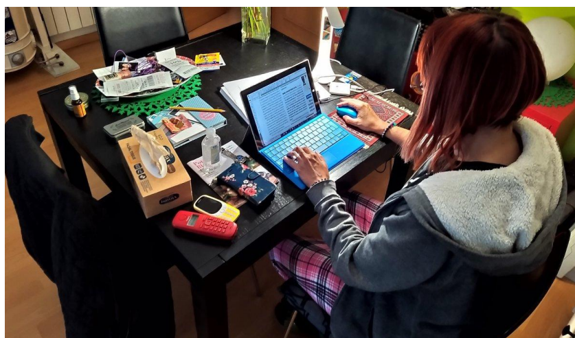
Figura 2. El teletrabajo una nueva normalidad para unos pocos

La jornada laboral en el teletrabajo “legalmente, es la relación formal entre el empleador y el trabajador, ésta no debe presentar cambios de fondo a la que existía anteriormente. Exige el acuerdo mutuo entre las partes, respecto al tipo de actividades a realizar, tiempo de trabajo y los entregables o productos esperados de su teletrabajo”, según manifiestan las autoridades del trabajo [3].